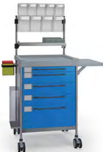
3687 B 365 B.26(RA4.A5.R2).30.33L.44L