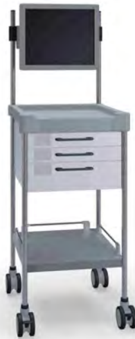
Q026 W SQ021 W.26M(R75QM)

Without keyboard drawer Sin cajón para teclado