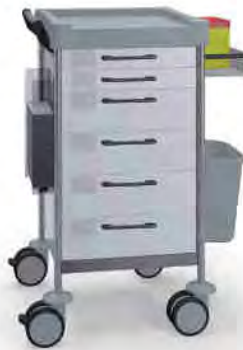
Q106 W SQ161 W.32R.46.50