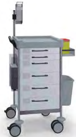
Q112 W SQ161 W.32R.46.48L.50