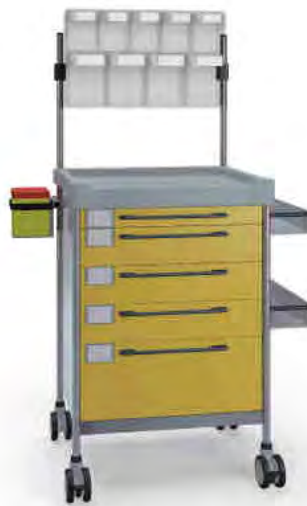
3609 Y 365 Y.26(RA4.A5).(2)32R.33L