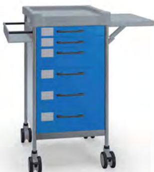
Q072 B SQ061 B.30.32L