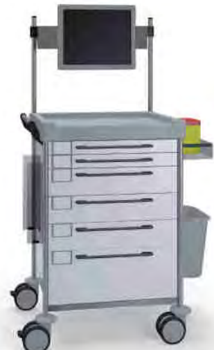
1690 W 162M6TX W.26M(R75M). 32R.46.50