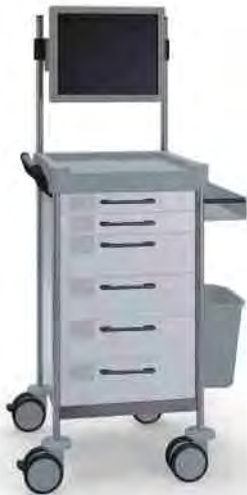
Q186 W SQ161 W.26M(R75QM).32R.50 Without keyboard drawer Sin cajón para teclado