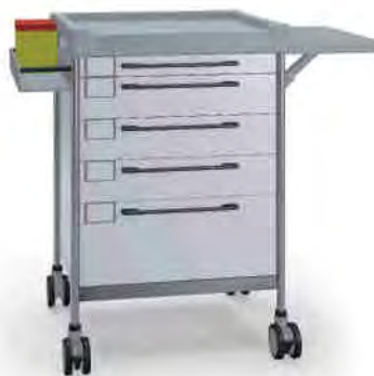
3131 W 365 W.30.32L