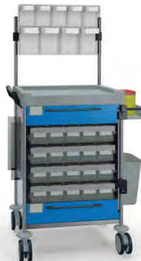
1895 B 114M6 B.26(RA4.A5).32R.46.50