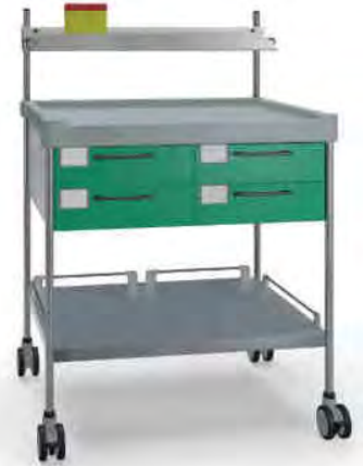
3800 G N322 G.26LW(R1N)