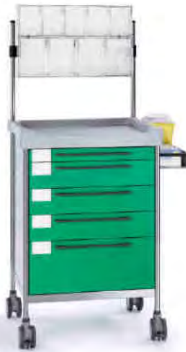
3607 G 365 G.26(RA4.A5).32R