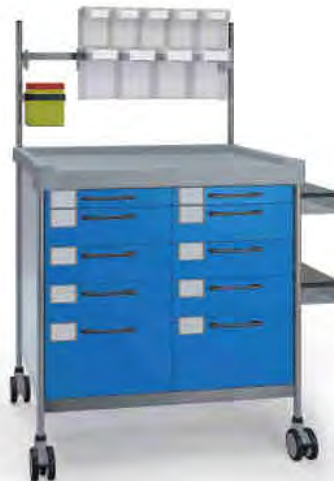
3934 B N365 B.26(RA4N.A5).(2)32NR.33L