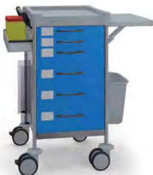
Q142 B SQ161 B.30.32L.46.50