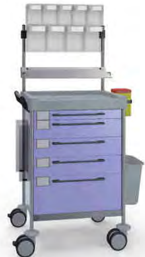
1638 F 165 F.26(RA4.A5.R1).33R.46.50