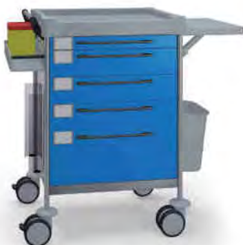
1642 B 165 B.30.32L.46.50