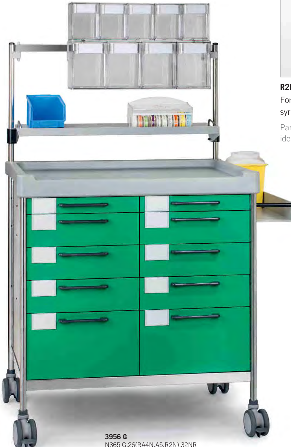
3956 G N365 G.26(RA4N.A5.R2N).32NR

Para etiquetas de medicación, identificación de jeringuillas