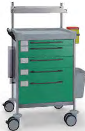
1636 G 165 G.26LW(R1).33R.46.50