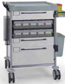
1808 W 108M6 W.32R.46.50