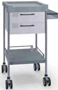
Q025 W SQ022 W.32R