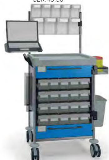
1896 B 114M6 B.26(RA4.A5). 27EV.32R.46.50