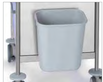
BIN (Optional) CUBO (Opcional)

50 - 13 LITRES LITROS 51 - 26 LITRES LITROS