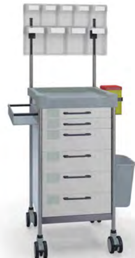
Q064 W SQ061 W.26(RA4Q.A5).32L.33R.50