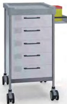
Q055 W SQ065 W.32R