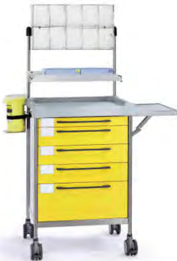
3680 Y 365 Y.26(RA5.A5.R1).30.33L