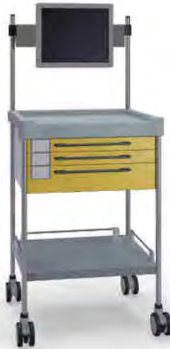
3170 Y 321TX Y.26M(R75M)