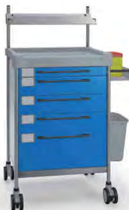
3137 B 365 B.26LW(R1).32R.50