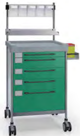
3141 G 365 G.26(RA5.R1).32R