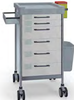
Q063 W SQ061 W.32L.33R.50