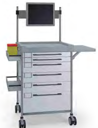
3695 W 362M6TX W.26M(R75M).30.(2)32L