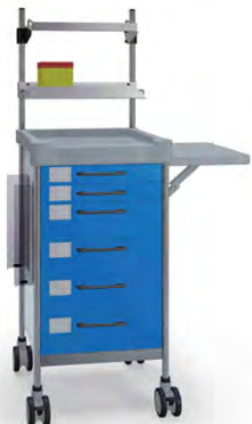
Q078 B SQ061 B.26(R2Q.R1Q).30.46