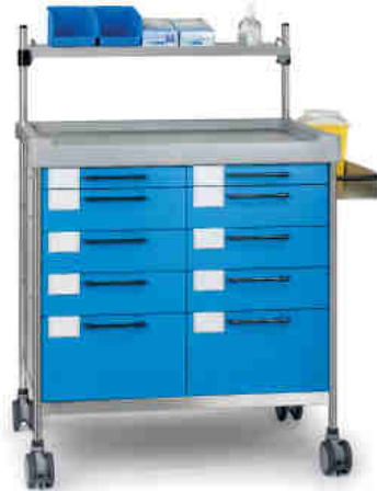
3826 B N365 B.26LW(R2N).32NR