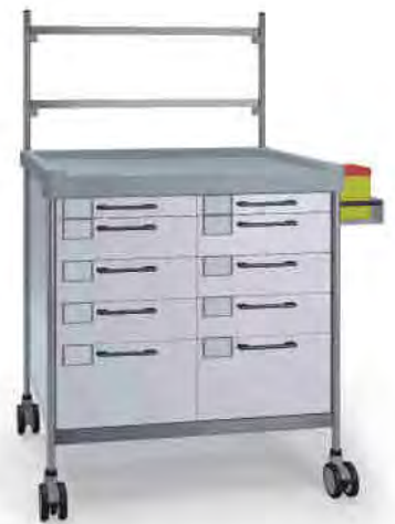
3840 W N365 W.26(R7N.R7N).32NR