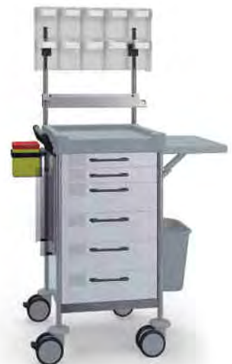
Q158 W SQ161 W.26(RA5Q.A5.R1Q). 30.33L.46.50