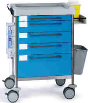
1606 B 165 B.32R.46.50