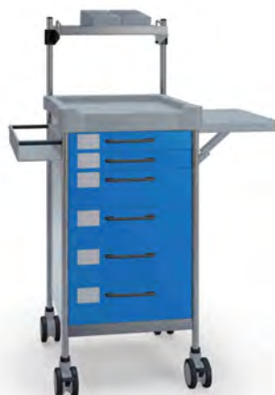
Q073 B SQ061 B.26LW(R2Q).30.32L