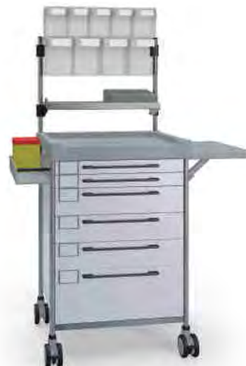
3694 W 362M6 W.26(RA4.A5.R2).30.32L