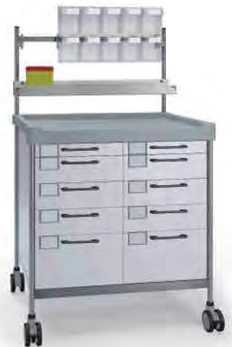
3942 W N365 W.26(RA5N.A5.R1N)