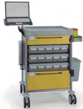
1813 Y 112M6 Y.27.32R.46.50