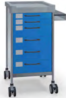
Q054 B SQ061 B.32R

Without keyboard drawer Sin cajón para teclado