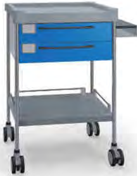
3102 B 322 B.32R