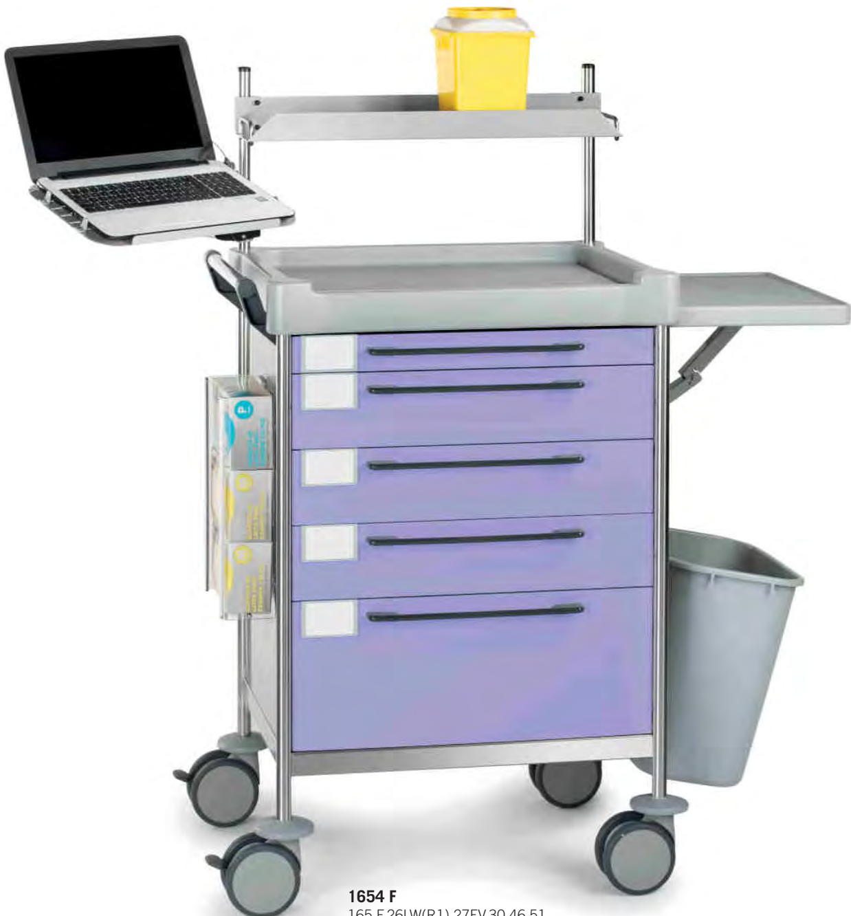
1654 F 165 F.26LW(R1).27EV.30.46.51