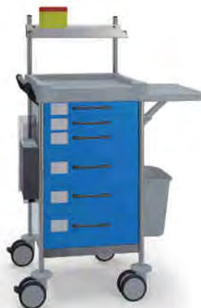
Q150 B SQ161 B.26LW(R1Q).30.46.50