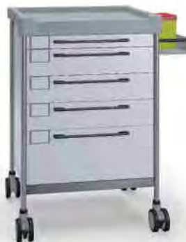
3129 W 365 W.32R