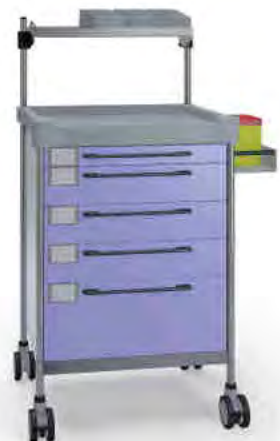
3135 F 365 F.26LW(R2).32R