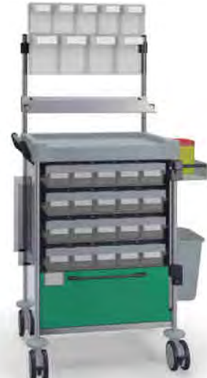
1838 G 116M6 G.26(RA4.A5.R1). 32R.46.50