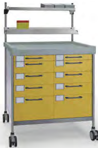
3830 Y N365 Y.26(R2N.R1N)