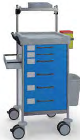
Q128 B SQ161 B.26LW(R2Q).32L.33R.50