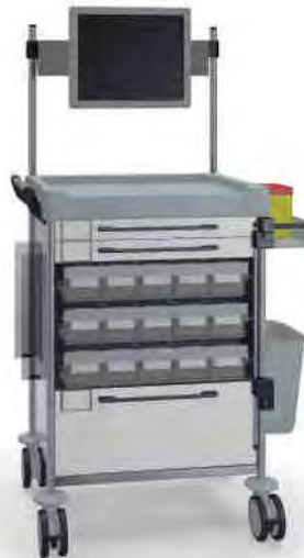
1828 W 110M6TX W.26M(R75M).32R.46.50