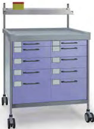
3818 F N365 F. 26LW(R1N)