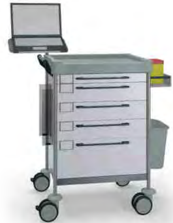
1608 W 165 W.27.32R.46.50