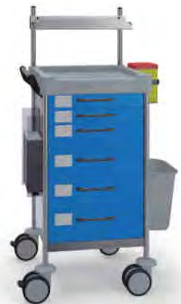
Q136 B SQ161 B.26LW(R1Q).33R.46.50