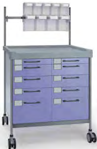
3928 F N365 F.26(RA4N.A5)