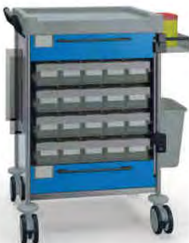
1894 B 114M6 B.32R.46.50