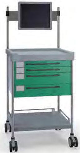
3174 G 332TX G.26M(R75M)