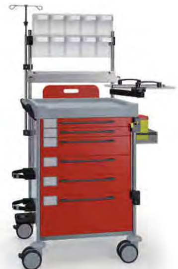
1210 R 162M6 R.12.14.26(RA5.A5.R1). 28EV.32R.34.36.40