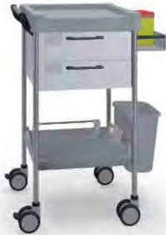
Q605 W SQ022 W.AST.32R.50 Wheels Ruedas Ø 100 mm