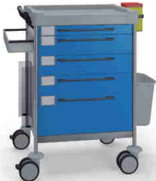
1625 B 165 B.32L.33R.46.50